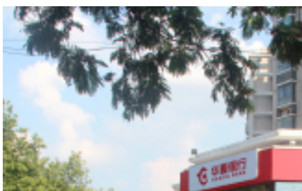
鼓楼龙江 清江苏宁广场 河西...