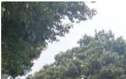
南京市江宁区 300 亩 15 万园...